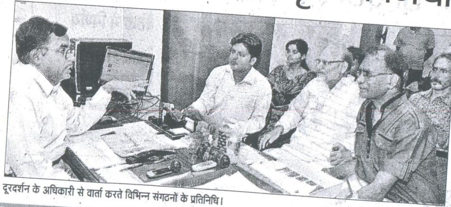
दूरदर्शन के अधिकारी से वार्ता करते विभिन्न संगठनों के प्रतिनिधि।

इधर, भाकपा माले के जिला सचिव ने कहा है कि उपकरणों को बाहर भेजे जाने से मुजफ्फरपुर की कलात्मक गतिविधियां प्रभावित होंगी। पार्टी स्थानीय कला को संरक्षित करने व कलाकारों को उचित मंच प्रदान करने के लिए जोरदार तरीके से अभियान चलाएगी।